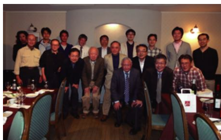
コース終了後の懇親会風景

今まで上流工程のプロジェクトに携わる際は、判断基準や行動基準が自分の中で明確になっておらず、「これでいいのか?」と自問を繰り返すことが多かったと思います。今回のケース研修では、ITによる改革のきっかけ作りからIT導入後の振り返りまでの各工程で必要となる知識を、体系的かつ実践的に習得することができました。この結果、上流工程で必要となる活動の指針が自分の中で確立でき、今までよりも余裕をもった対応ができるようになったと実感しています。