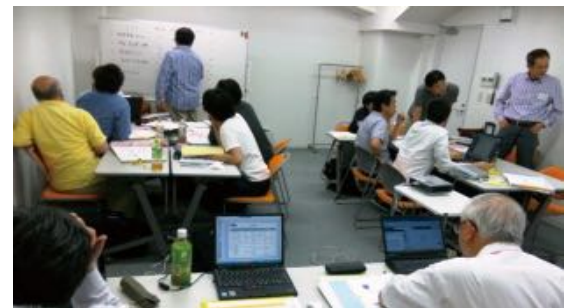
グループ討議風景