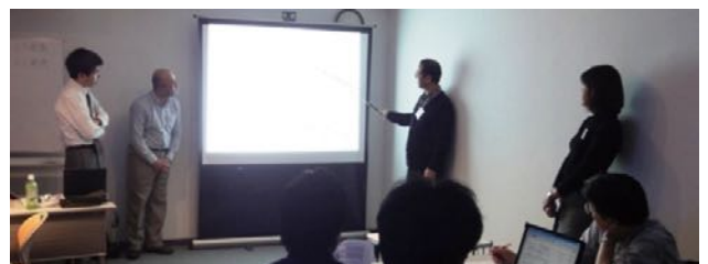
コース最終日のプレゼンテーション風景

ウラ面⇒「お申込み方法」、「具体的なケース研修の流れ」、「ITコーディネータとは」、「ITコーディネータ資格取得のメリット」、「ケース研修受講者の声」、「ITMSについて」