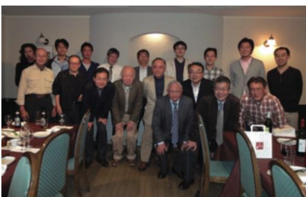
コース終了後の懇親会風景

今まで上流工程のプロジェクトに携わる際は、判断基準や行動基準が自分の中で明確になっておらず、「これでいいのか?」と自問を繰り返すことが多かったと思います。今回のケース研修では、ITによる改革のきっかけ作りからIT導入後の振り返りまでの各工程で必要となる知識を、体系的かつ実践的に習得することができました。この結果、上流工程で必要となる活動の指針が自分の中で確立でき、今までよりも余裕をもった対応ができるようになったと実感しています。