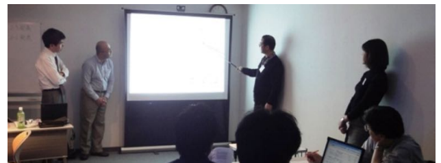
コース最終日のプレゼンテーション風景

ウラ面⇒「お申込み方法」、「具体的なケース研修の流れ」、「ITコーディネータとは」、「ITコーディネータ資格取得のメリット」、「ケース研修受講者の声」、「ITMSについて」